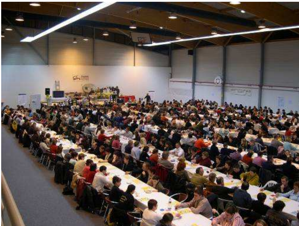
(ci-dessus une vue du loto du 25 mars 2006, la salle est aussi utilisée par les sections sportives...)

La salle omnisports où différentes sections vous proposent de les rejoindre :